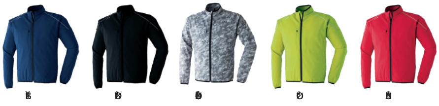
色 青 青 黒 迷彩 黄緑 赤