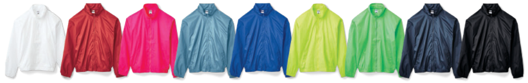
色 白 赤 桃 水色 青 水色 黄緑 緑 青 黒