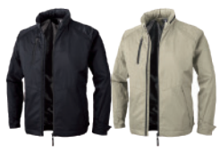
色 青 黄緑