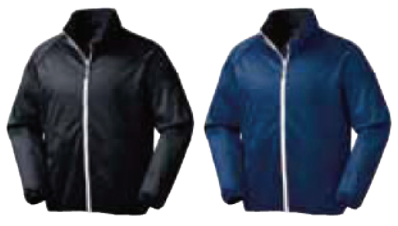
色 赤 黒 青